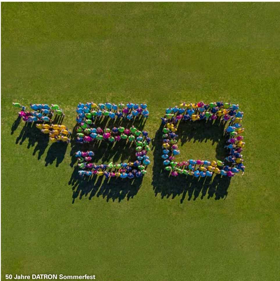
50 Jahre DATRON Sommerfest