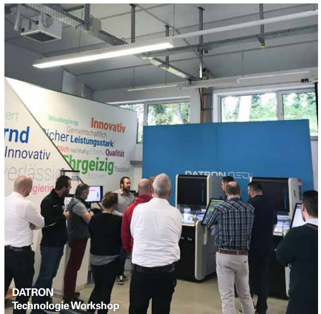
DATRON Technologie Workshop