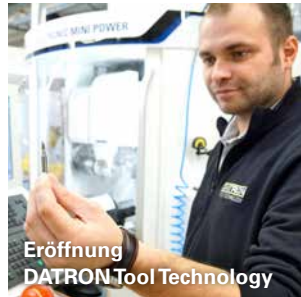
Eröffnung DATRON Tool Technology