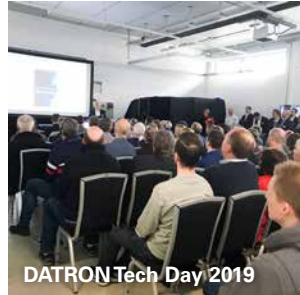
DATRON Tech Day 2019