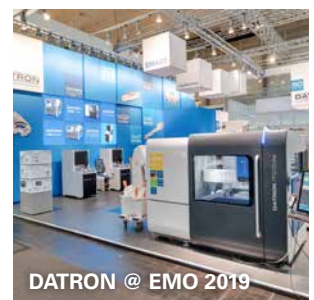
DATRON @ EMO 2019