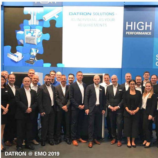
DATRON @ EMO 2019