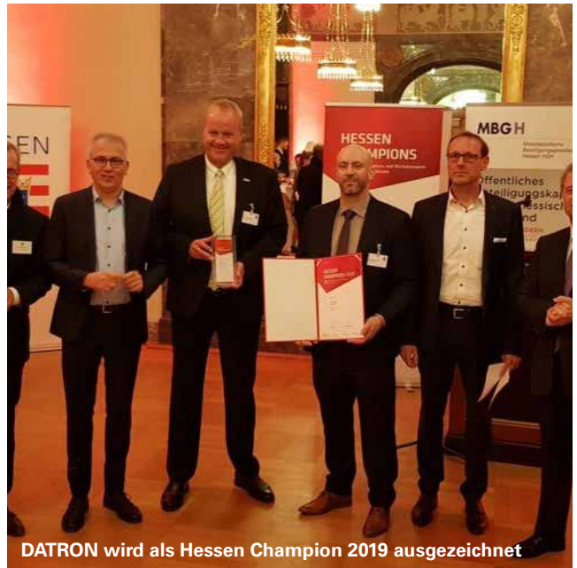
DATRON wird als Hessen Champion 2019 ausgezeichnet