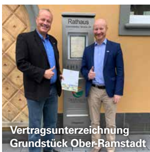
Vertragsunterzeichnung Grundstück Ober-Ramstadt