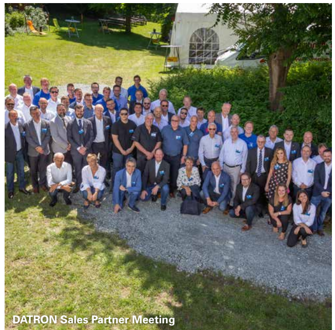
DATRON Sales Partner Meeting